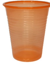
007716 Farbcode: 4400