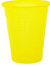
007715 Farbcode: 4300