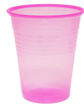
007720 Farbcode: 6400