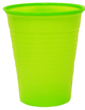
007719 Farbcode: 4200