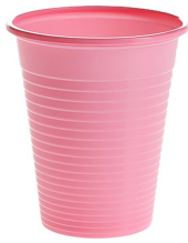
007714 Farbcode: 6300