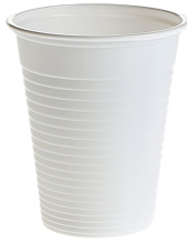
007710 Farbcode: 1100