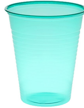
007712 Farbcode: 3000