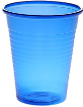
007711 Farbcode: 2000