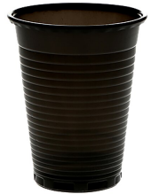
007718 Farbcode: 1000