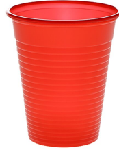
007717 Farbcode: 6000