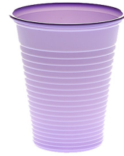
007713 Farbcode: 6200